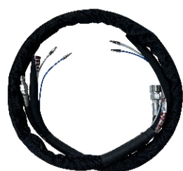
TUYAU DE TIR DOUBLE TUBE - 2.0 m