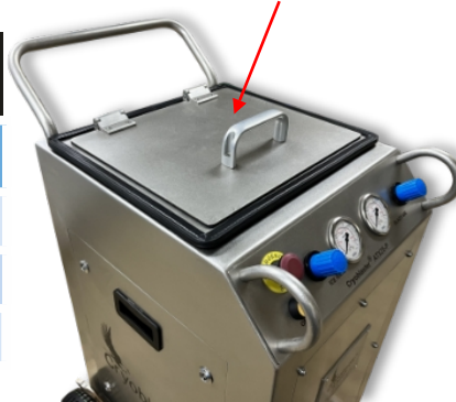
Cuve Inox 304 : 25 kg